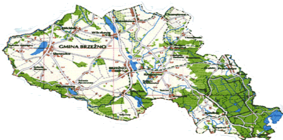
Rysunek 1. Gmina Brzeżno

Przez miejscowość Rzepczyno przebiegają dwie drogi powiatowe: Słonowice – Brzeżno – Rzepczyno – Przyrzecze oraz Świdwin – Koszanowo – Rzepczyno – Karsibór, których zarządcą jest Powiatowy Zarząd Dróg w Świdwinie. Rzepczyno posiada dogodne połączenia z miejscowością Brzeżno, jako jednostką gminną i Świdwinem - miastem powiatowym. Wieś Rzepczyno pełni funkcje rolniczą.