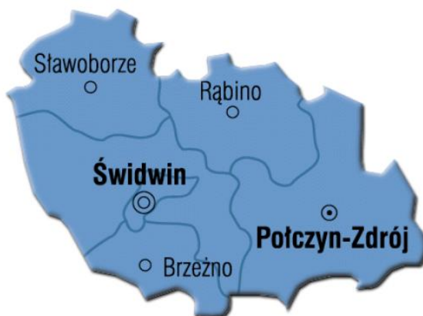
RYSUNEK NR 1 Położenie gminy Brzeżno na tle powiatu świdwińskiego.

Gmina Brzeżno jest gminą wiejską, typowo rolniczą, położoną w środkowej części województwa zachodniopomorskiego, w południowej części Powiatu Świdwińskiego. Gmina Świdwin wraz z miastem otacza Gminę Brzeżno z trzech stron – od zachodu, północy i wschodu. Granice południowa wyznaczają gminy: Ostrowice oraz Drawsko Pomorskie. Natomiast południowo-zachodnia granica Gminy Brzeżno jest wspólna z Gminą Łobez. Powierzchnia gminy: 111 km 2 . Sieć osadnicza gminy obejmuje 20 miejscowości, które składają się w 11 wsi sołectkich. Zdecydowana większość jednostek osadniczych posiada zwarty charakter zabudowy. Wyjątkiem jest Karsibór. Brzeżno jest siedzibą władz gminy. W nim zlokalizowane są ośrodki samorządu. Jednak większość historycznie wytworzonych ciężarów społeczno – gospodarczych jakie wypływają z okalających obszarów skupia się w powiatowym mieście Świdwin, położonym w niewielkiej odległości od gminy w kierunku północnym.