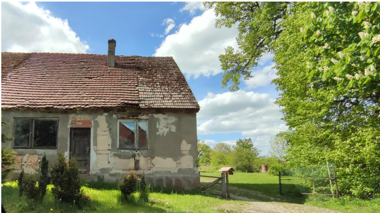
Rysunek 5. Nieużytkowana, niszcząca zabudowa mieszkalna na terenie z załącznika nr 1 (zdj. własne)