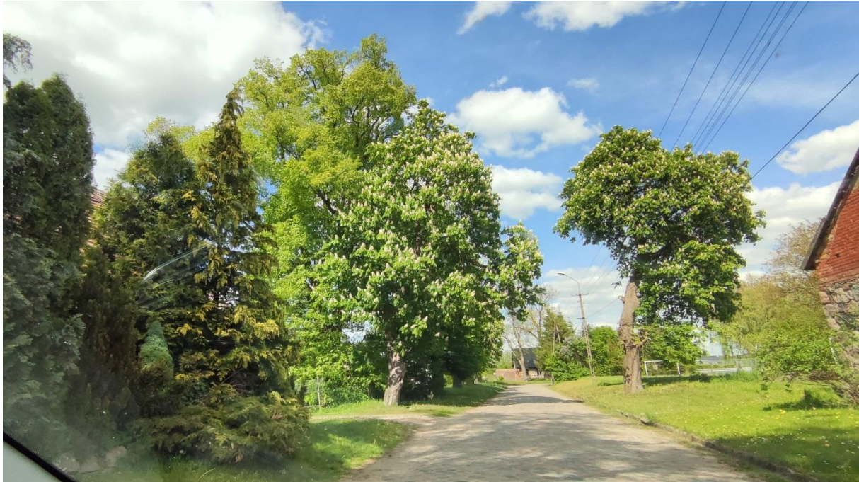
Rysunek 4. Widok na z drogi powiatowej na oba tereny opracowania (z lewej strony teren z załącznika nr 1, z prawej z załącznika nr 2)