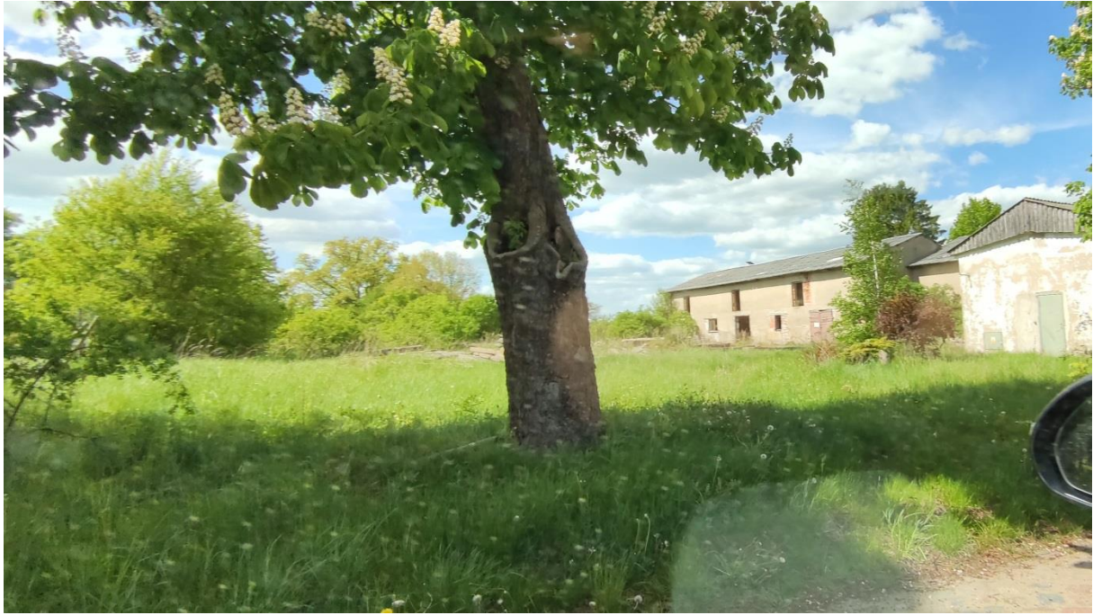
Rysunek 6. Zabudowa gospodarcza na terenie z załącznika nr 1 (zdj. własne)