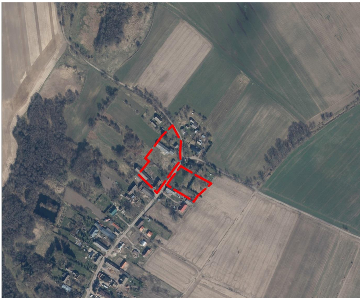
Rysunek 3. Lokalizacja obszaru opracowania planu miejscowego na tle sąsiedztwa, (źródło: geoportal.gov.pl)