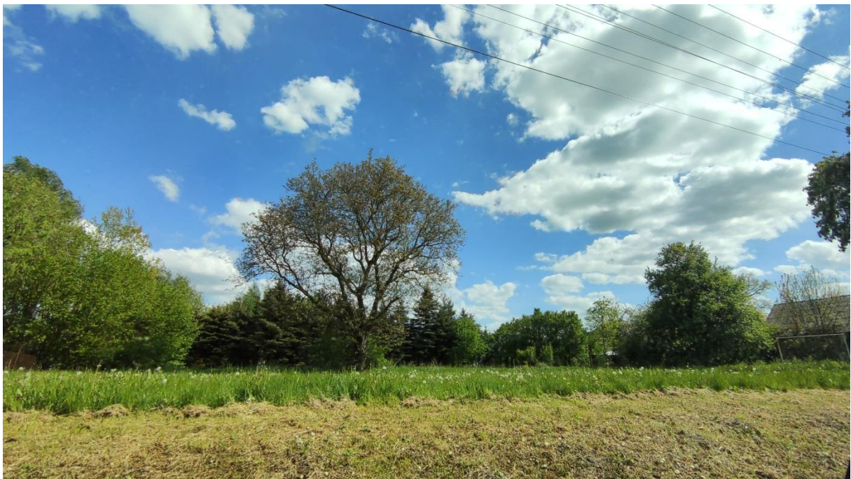
Rysunek 7. „Dzikie” boisko oraz zadrzewienia w granicach terenu nr 2