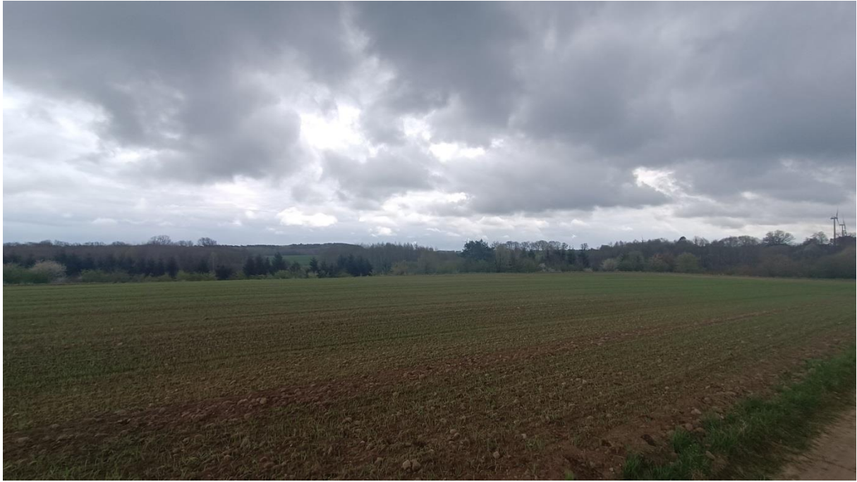
Rysunek 7. Widok w kierunku wsi Póchlebs na teren 1.2 PEF z drogi 1.1 KR