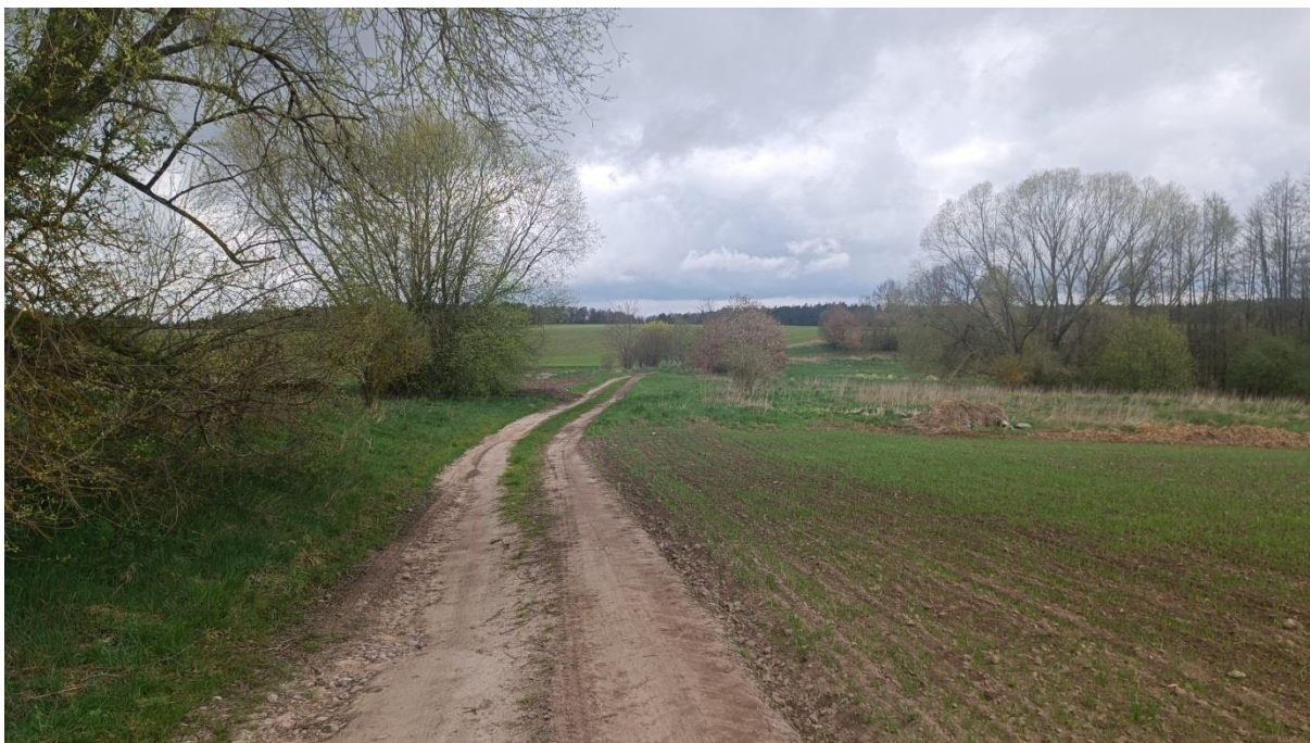
Rysunek 6. Widok w kierunku północno-zachodnim z drogi 1.1 KR, z prawej strony atrakcyjne przyrodniczo tereny zadrzewień oraz zakrzaczeń położonych w obniżeniu terenu (poza obszarem opracowania planu)