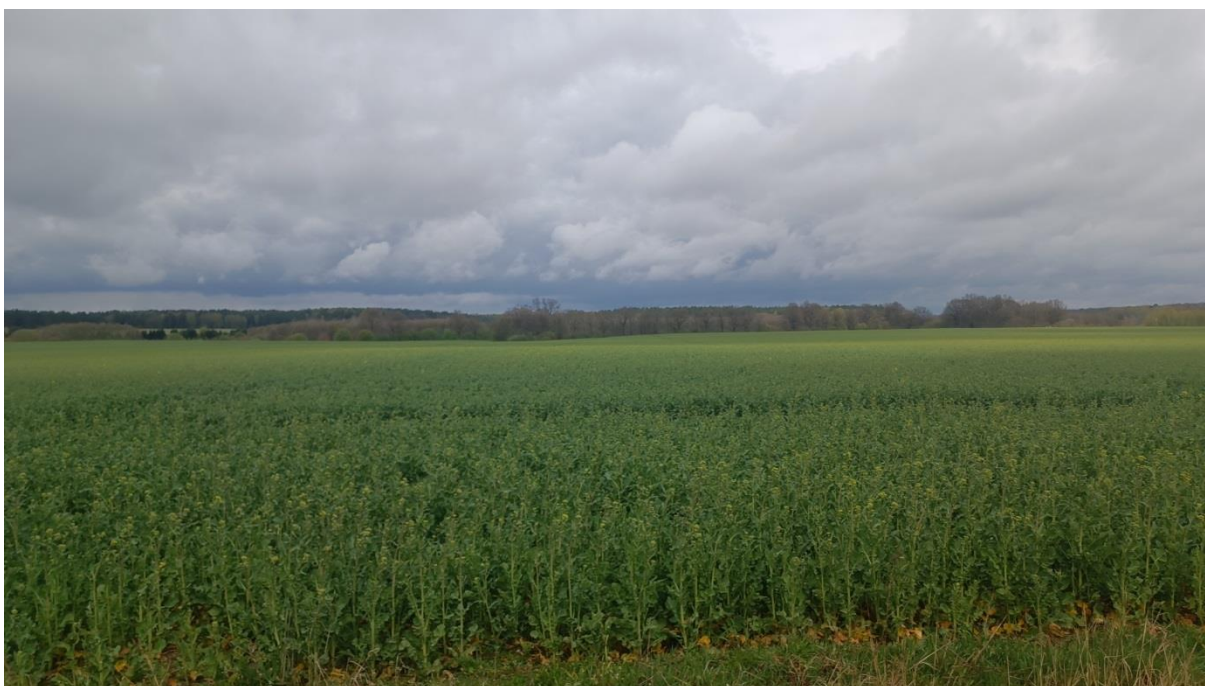
Rysunek 4. Widok na z drogi powiatowej w kierunku północnym na teren opracowania planu (jednostka 2.2 PEF), w tle widoczna ściana lasu