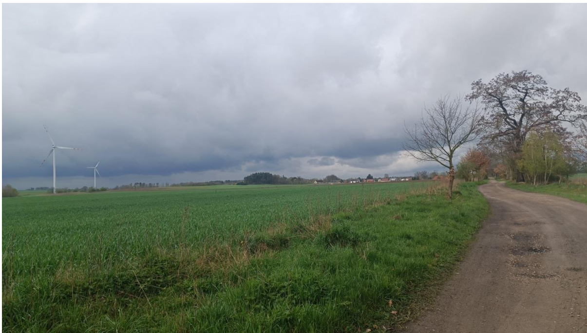
Rysunek 3. Widok na z drogi powiatowej teren opracowania planu (jednostka 2.3 PEF), po lewej stronie widoczne elektrownie wiatrowe