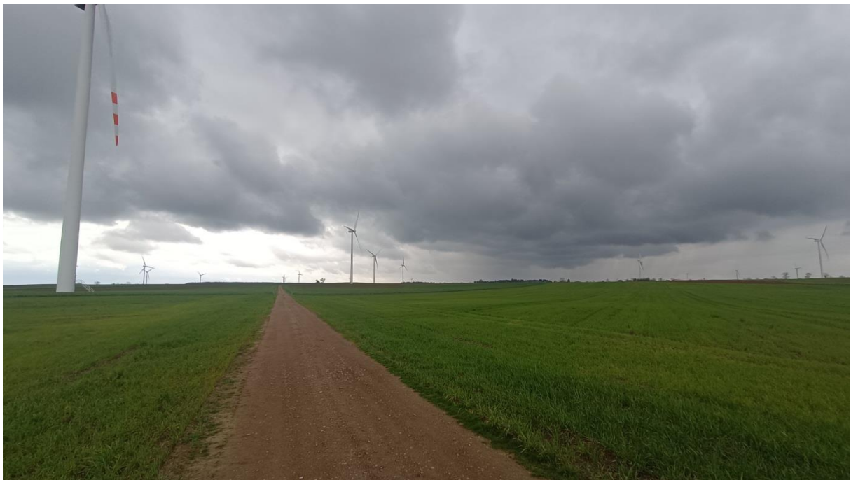
Rysunek 8. Widok na elektrownie wiatrowe i tereny rolnicze z drogi 3.1 KR