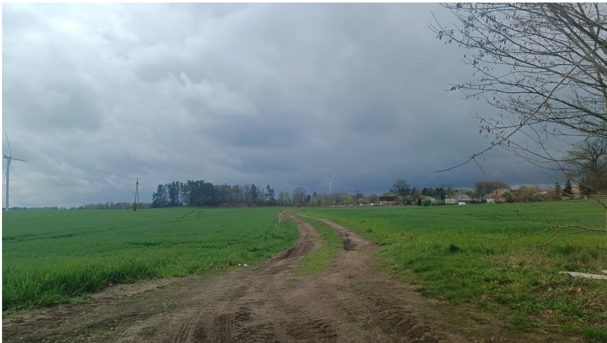
Rysunek 5. Widok na zachodnią część jednostki 2.3 PEF, z prawej strony zdjęcia zabudowania wsi Pótleb