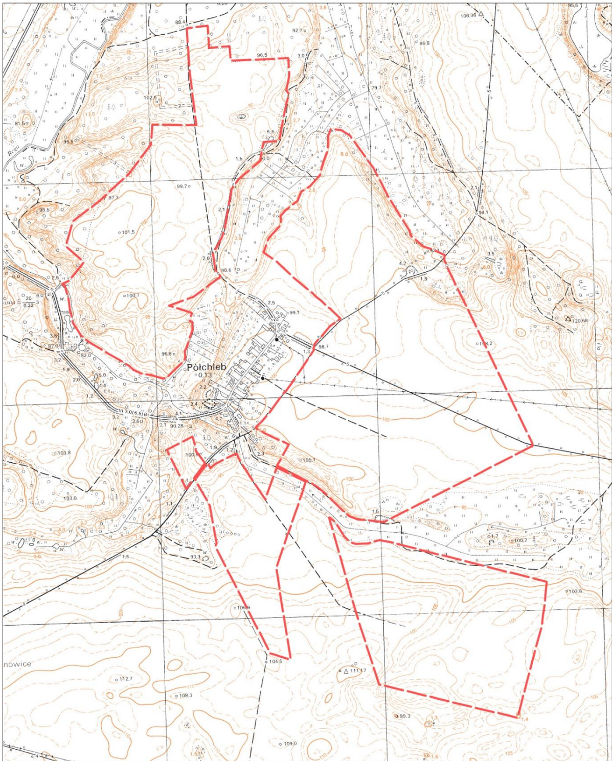
Rysunek 2. Lokalizacja obszaru opracowania planu miejscowego na tle najbliższego sąsiedztwa (opracowanie na tle mapy topograficznej pochodzącej z geoportal.gov.pl )